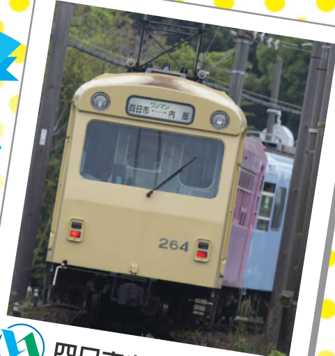
四日市あすなろう鉄道